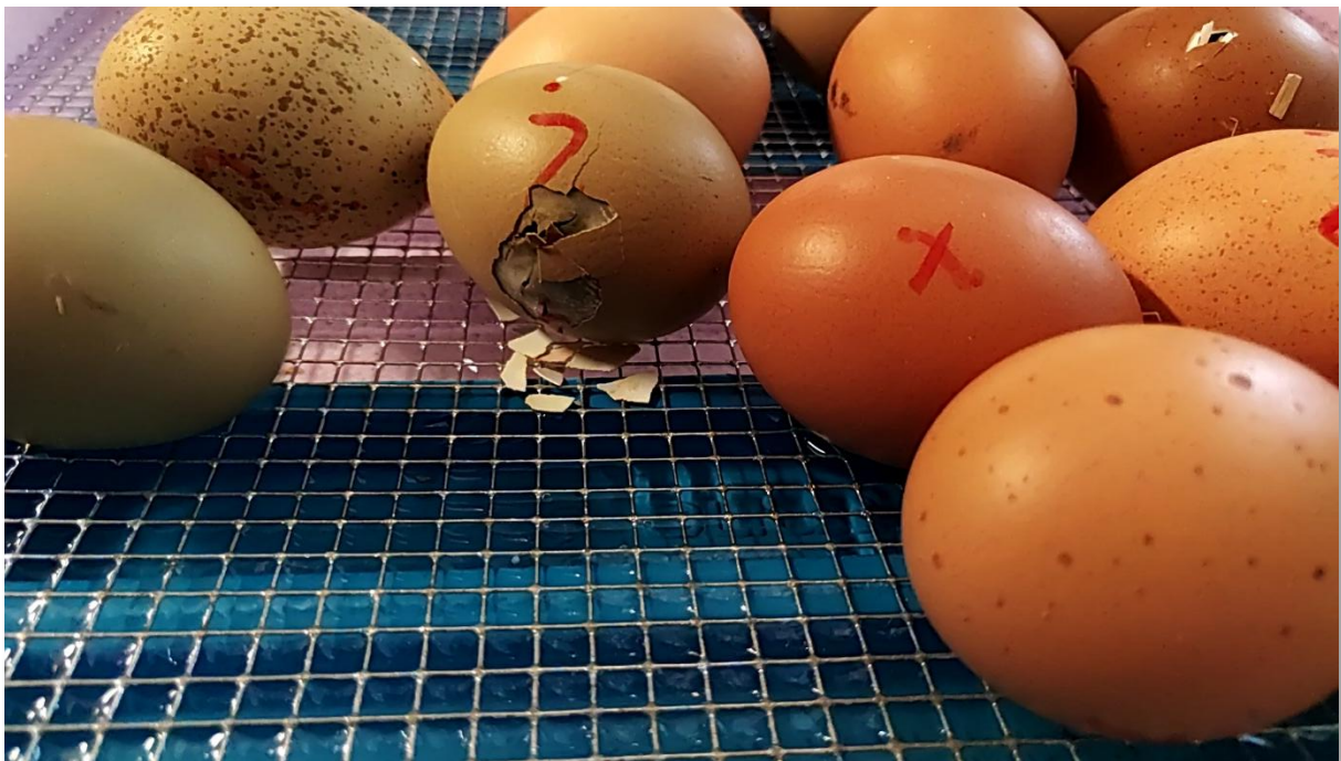
Durchbruch – ein Küken auf dem Weg in die Welt

Liebe Schüler*innen, liebe Kolleg*innen, liebe Eltern,